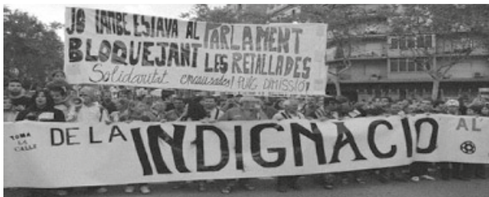
Acció de protesta en format manifestació

Per primera vegada la societat civil espanyola s'organitzava tota sola, i sembla que s'ha marcat un canvi d'època en la història de les mobilitzacions socials. Les xarxes socials, sobretot Twitter, van convertir la protesta del 15M en un dels temes més comentats del món en aquelles dates.