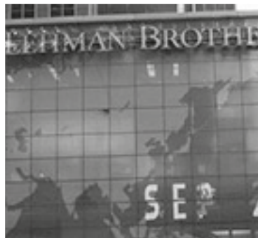
Oficines de Lehman Brothers als EUA

Durant l'any 2008 la situació econòmica mundial es va anar agreujant progressivament. El juliol de 2008 el preu del petroli va arribar a un màxim històric i el mes de setembre va haver-hi el gran xoc financer als EUA per la fallida de Lehman Brothers , que era una banca d'inversió i de serveis financers que es va veure seriosament afectada per la crisi de les hipoteques subprime . Aquest fet va sacsejar i paràlitzar l'activitat de tots els mercats, va frenar en sec l'activitat econòmica mundial i va arrossegar a la baixa totes les borses internacionals