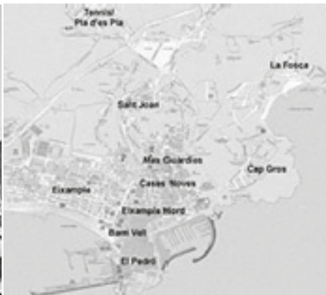
Façana marítima i plànol del municipi de Palamós